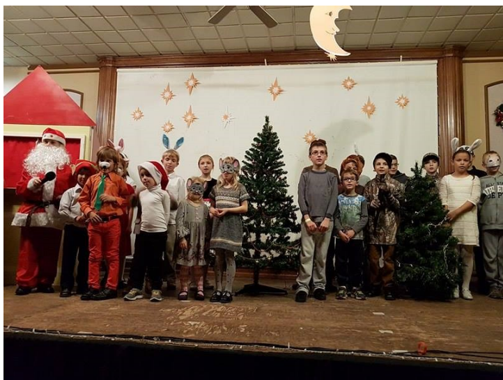
Az iskolások szereplése