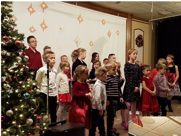
Teltházas karácsonyi vásár és Mikulás ünnepség.